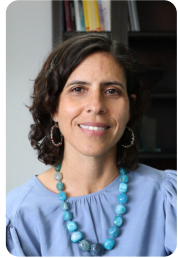
Paula Bogantes, Ministra del Ministerio de Ciencias, Tecnología, Innovación y Telecomunicaciones