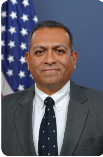
Michael Flores, Ministro Consejero de la Embajada de los Estados Unidos de América en Costa Rica